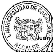
Juan Alfonso Barros Díez Alcalde (S) Ilustre Municipalidad de Casablanca