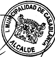
RODRIGO MARTINEZ ROCA Alcalde de Casablanca