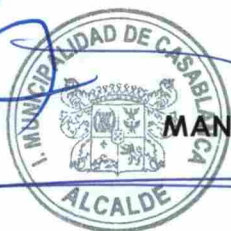
MANUEL JESUS VERA DELGADO Alcalde de Casablanca