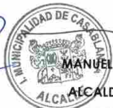
MANUEL JESÚS VERA DELGADO ALCALDE DE CASABLANCA