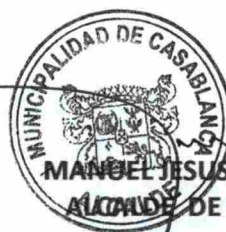
MANGEL JESUS VERA DELGADO ALCALDE DE CASABLANCA