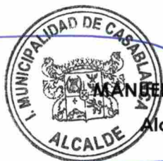
MANUEL JESUS VERA DELGADO Alcalde de Casablanca