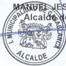
MANUEL JESUS VERA DELGADO Alcalde de Casablanca